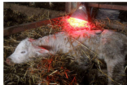
F Cotte GTV RA

Il s'agit d'un effet qui diminue les capacités de défense des animaux . Cet effet est notable. Il favorise le développement d'autres infections, comme les diarrhées des jeunes veaux : celles-ci ne sont pas dues directement au virus BVD, mais les germes responsables de ces diarrhées se développent plus facilement.