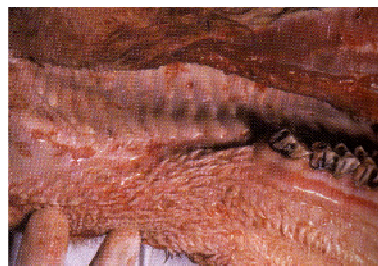
Ulcères buccaux

→ évolution inéluctable vers la mort, le plus souvent en 3 à 10 jours.