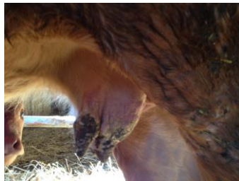
Atteinte de la mamelle